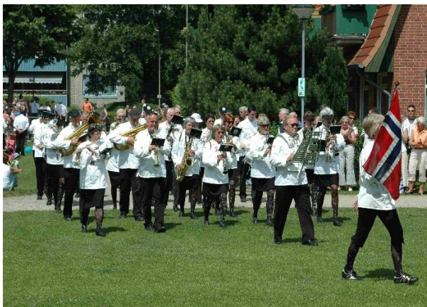
Innmarsj til Festplassen