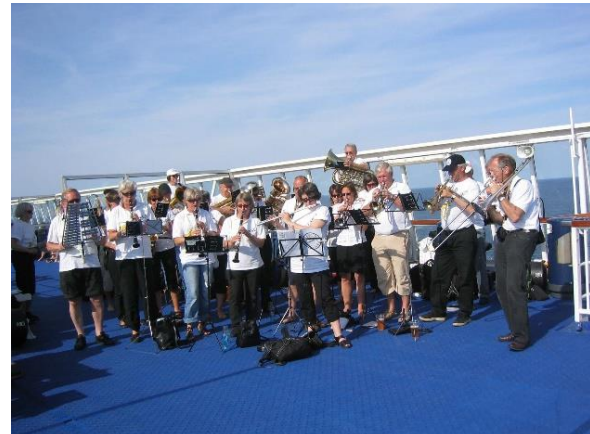
Dansebåten på vei hjemover