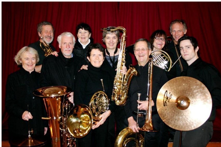
Litt av storbandet på swingkonserten i Stabekk kino 9. mars