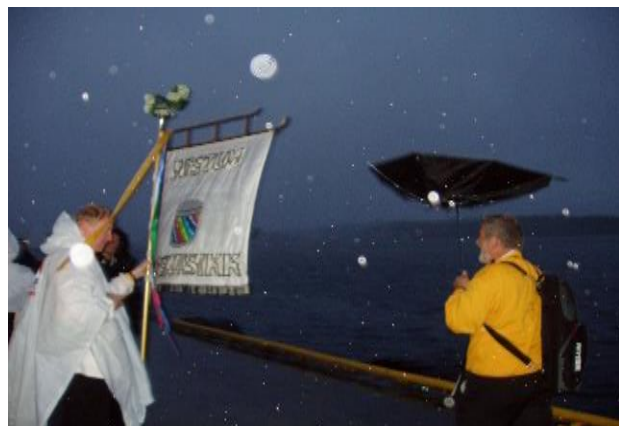
Både regn og vind i Brønnøysund