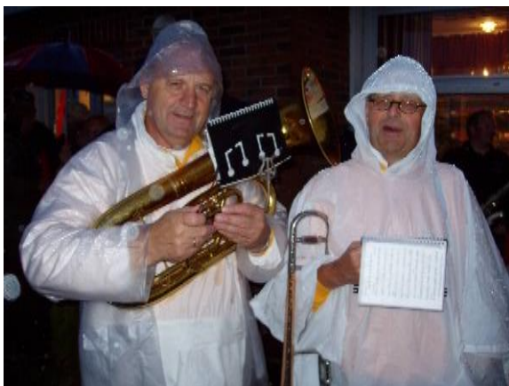
Det finnes bare fine klær!