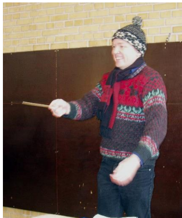
Det var veldig kaldt på Kongsberg – det året!