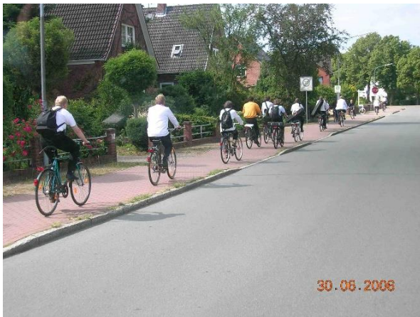
Stasen sykler mot bysentrum