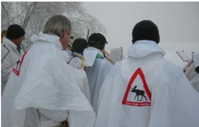
Elgvertrekket kom godt med i Kollen det året