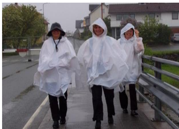
Godt å ha trekket på!