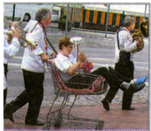
- og noen må sitte i vogn!