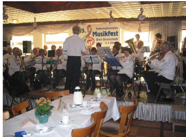
Konsert i Kaisersaal