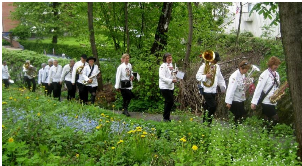
Stasen marsjerer 17. mai – intet oppdrag er godt nok gjemt!