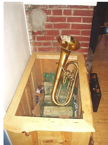
Instrumentet må varmes opp