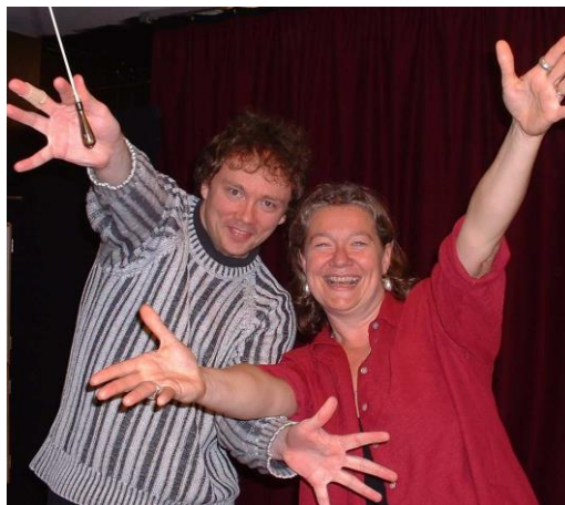
Dirigentene hadde det like morsomt som korps og kor!