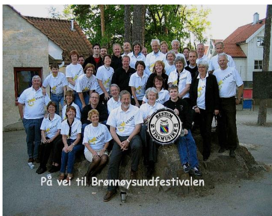
Stasen og Ullern Janitsjar er klare!